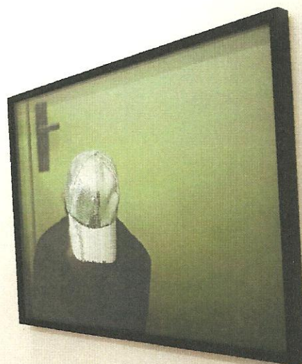
La Galerie Caroline Pagès présente une jolie sélection de jeunes talents portugais et français.

■ A Parreirinha d'Alfama. Beco do Espírito Santo Santo 1, Alfama. Tél. : +351 21 886 9436. Ouvert à partir de 20h, le fado commence à 21h.