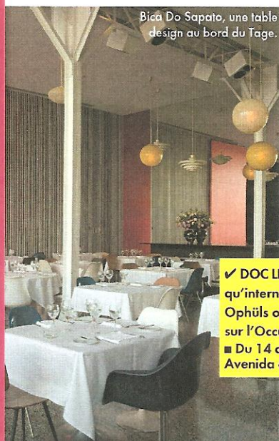
Bica Do Sapato, une table design au bord du Tage.

■ Kolovrat 79. Rua Dom Pedro V 79. Tél. : +351 21 387 4536