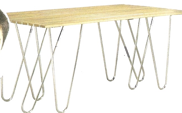
"Sketch", design Toni Grilo. Table pour Mooma