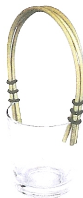
"Trois fois rien", design Toni Grilo, DIM