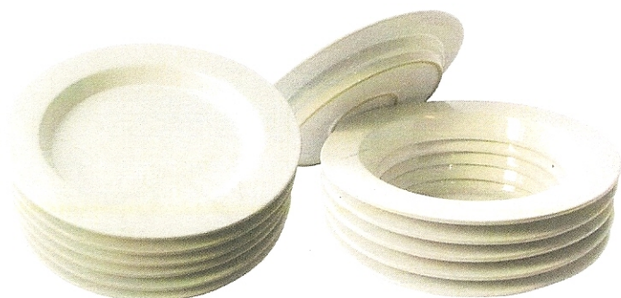
"Faux Semblant", design Toni Grilo, boîte en céramique