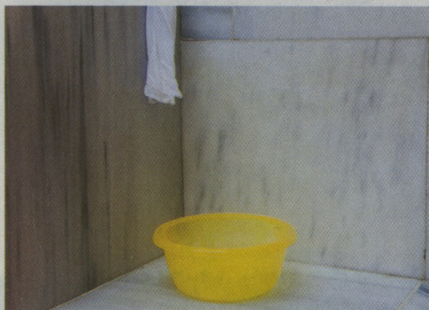
TIEMPO Y MODO, 2012