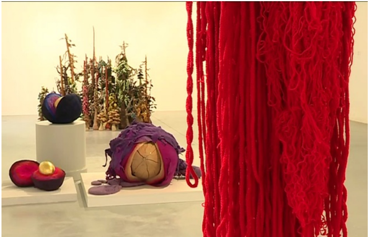
Un monde de textile à l'expo "De fils ou de fibres de Meymac"